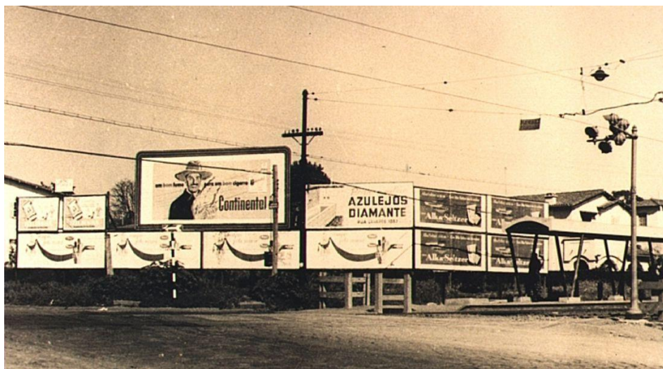
Foto 01: Diversos painéis, data provável déc. 1940, Av. Ascendino Reis, São Paulo/SP

No imaginário coletivo, muitas vezes, qualquer comunicação visual é reconhecida como “outdoor”, termo difundido nas décadas de 1970 e 1980 visando estabelecer um novo padrão de produto em relação aos reconhecidos cartazes das décadas anteriores que não possuíam padronização de medidas (Foto 01 e Foto 02).