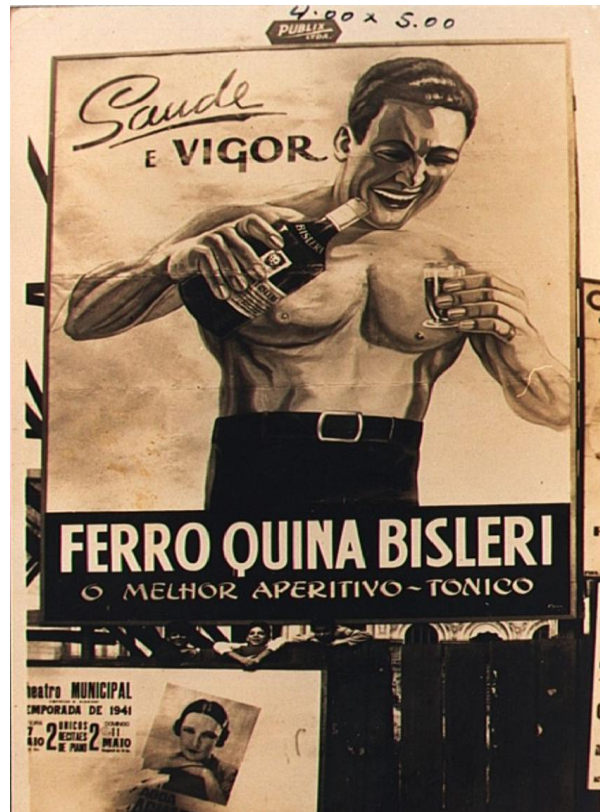
Foto 02: Pannel da empresa Publix, 1941, Av. São João esquina com R. Libero Badaró, São Paulo/SP.