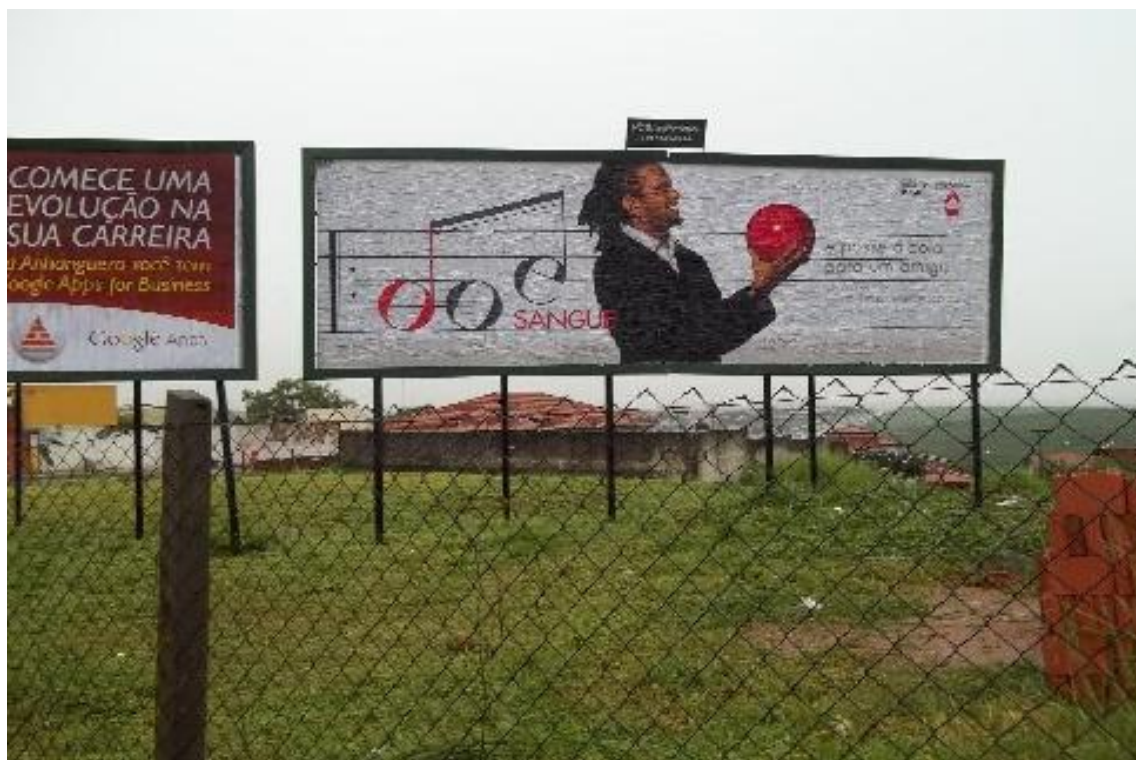
Foto 03: Campanha “Doe sangue e passe a bola” agência Publicis - Outdoor na cidade de Campinas.

No segundo semestre de 2011 está firmada a parceria com quatro universidades e uma escola de ensino básico (fundamental e médio): Universidade Metodista de São Paulo (São Bernardo do Campo); Universidade Anhembi Morumbi (São Paulo); Universidade São Caetano do Sul (São Caetano do Sul); Faculdades Integradas Torricelli (Guarulhos) e Colégio Sidarta (Cotia). Nessas entidades está previsto o seguinte roteiro de atividades: a) pesquisa das demandas locais/ou regionais; b) apuração e definição de temas; c) workshops sobre criação publicitária para mídia exterior; d) concurso para escolha das melhores campanhas (quando não se definir uma criação única, sem concorrência) e por fim a veiculação propriamente dita nos painéis ociosos da região em que se encontra a entidade ou em outras regiões (caso a caso).